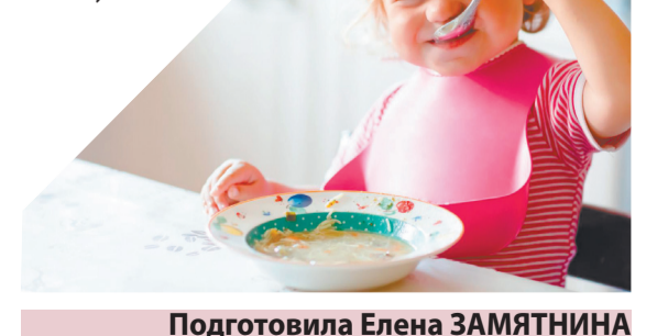
Подготовила Елена ЗАМЯТНИНА

В нашем распоряжении имеется утомленное до невероятной нежности мясо, насыщенный бульон, раздавленный рассыпчатый картофель и томленная же капуста. Теперь надо просто соединить всё это вместе и прогреть минут тридцать на минимальном огне (на плите), положить 2-3 листика лаврушки, досолить и поперчить. За 2-3 минуты до конца варки добавить мелко нарезанный свежий укроп и мелко нарубленный чеснок (2-3 зуб.). И не забудьте купить сметану.