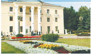
АДМИНИСТРАЦИЯ ЛЕНИНСКОГО ГОРОДСКОГО ОКРУГА МОСКОВСКОЙ ОБЛАСТИ