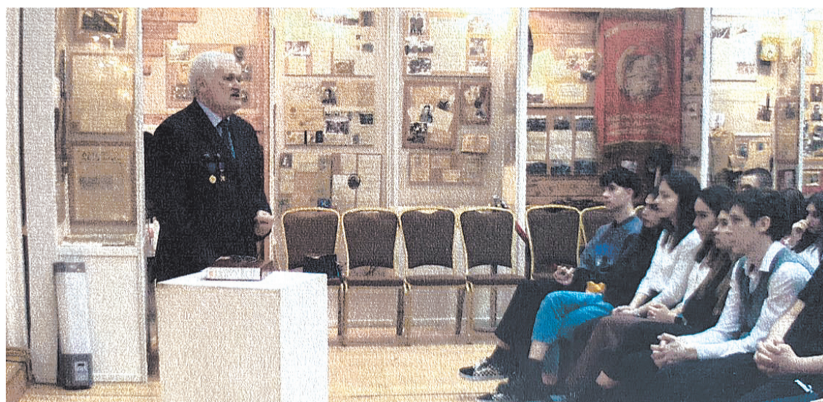
На уроке мужества со школьниками

Есть ли сейчас учителя, которые, как бывало раньше, говорят: «Кто не понял на уроке, останьтесь, я еще раз для вас повторю». Да у них просто нет для этого времени. Мне кажется, нагрузка и на учеников несколько завышена. В старших классах по 6, а то и 7 уроков в день. Кто-то проверял, сколько времени нужно ученику, чтобы подготовиться по всем заданным на следующий день предметам? А ведь хочется ещё погулять, позаниматься спортом, почитать книгу, уделить время любимому занятию. При этом и на здоровье ребёнка большая учебная нагрузка сказывается отрицательно.