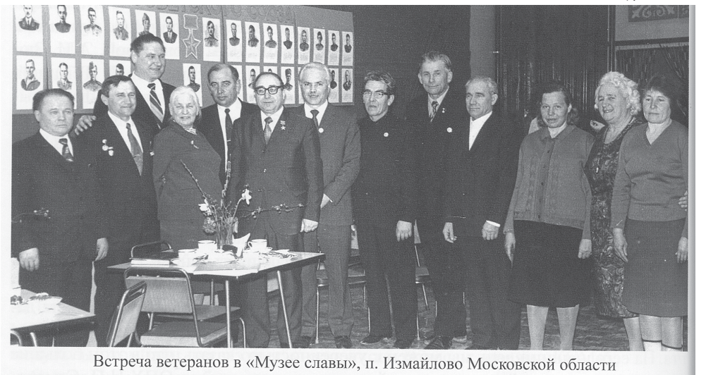
Встреча ветеранов в «Музее славы», п. Измайлово Московской области