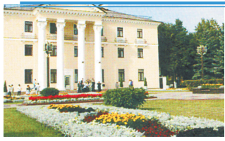
АДМИНИСТРАЦИЯ ЛЕНИНСКОГО ГОРОДСКОГО ОКРУГА МОСКОВСКОЙ ОБЛАСТИ