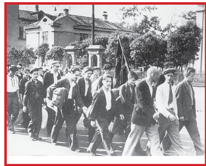
Ополченцы Ленинского района